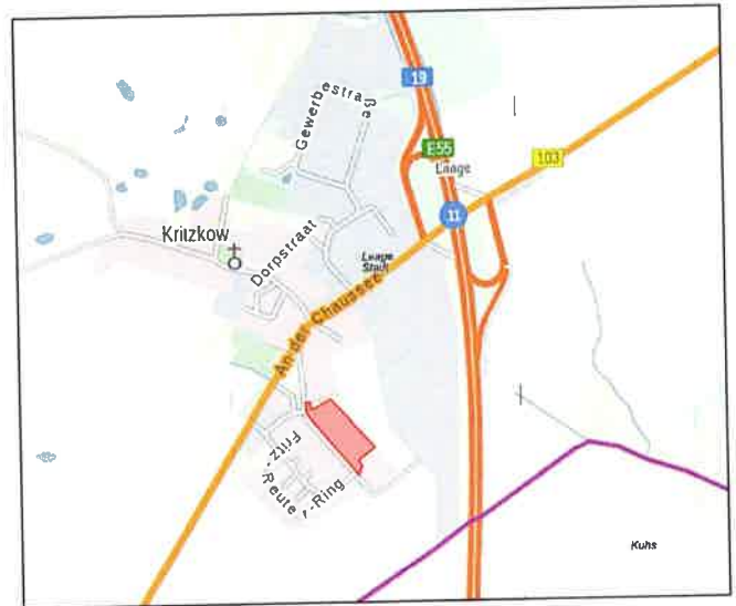
Übersichtsplan: Geltungsbereich des Bebauungsplans Nr. 31 – Zehlendorfer Weg.