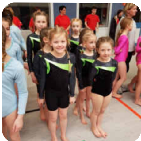
So sehen Sieger aus! Das Laager Turnteam S. 4