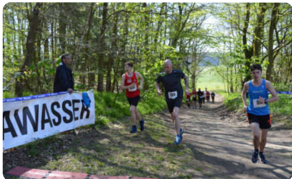
Das Foto zeigt Aktive im Laager Stadtwald.