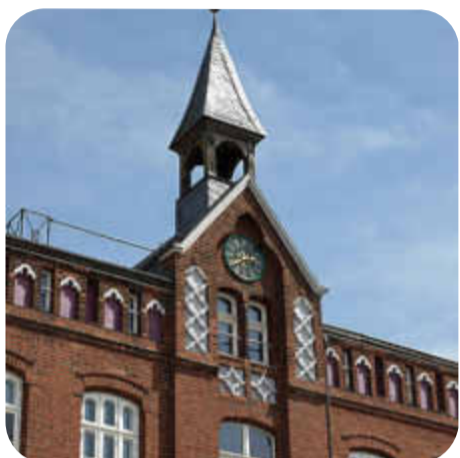
Bericht des Bürgermeisters auf der Sitzung der STV S. 2

DES AMTES LAAGE, DER STADT LAAGE SOWIE DER GEMEINDEN