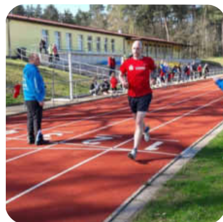
Wieder Sportabzeigentag in Laage S. 7